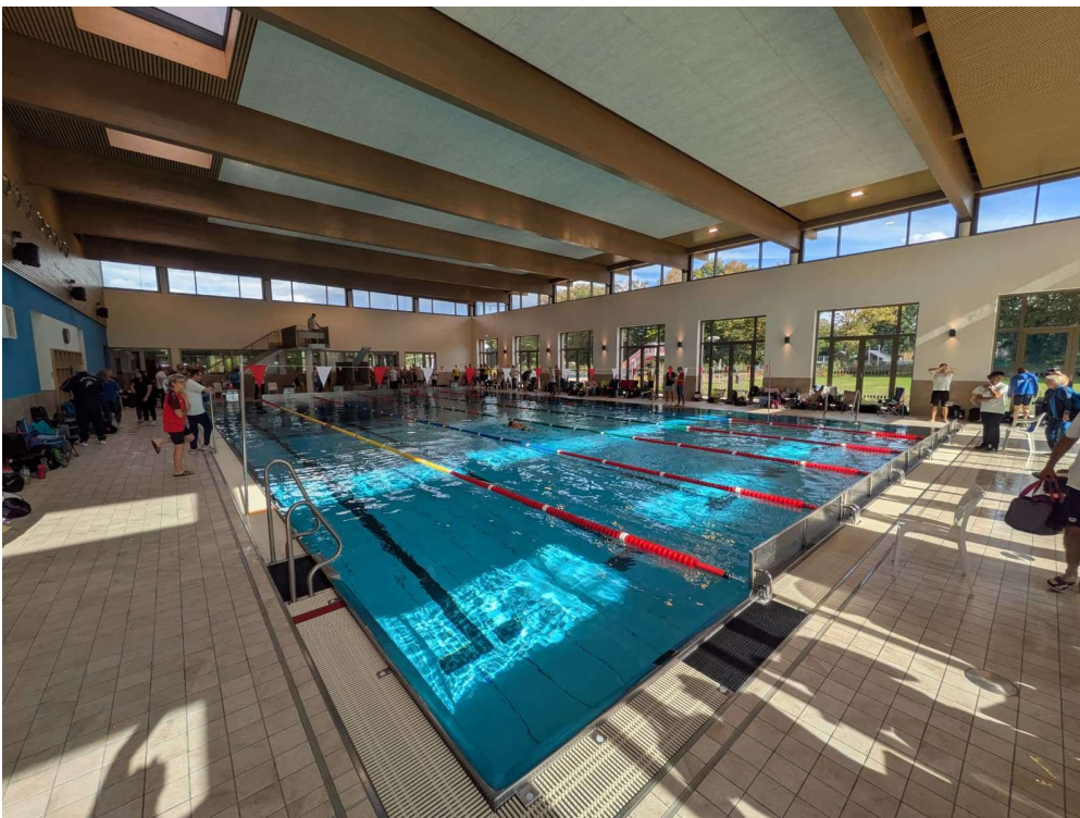
Sesekebad Kamen