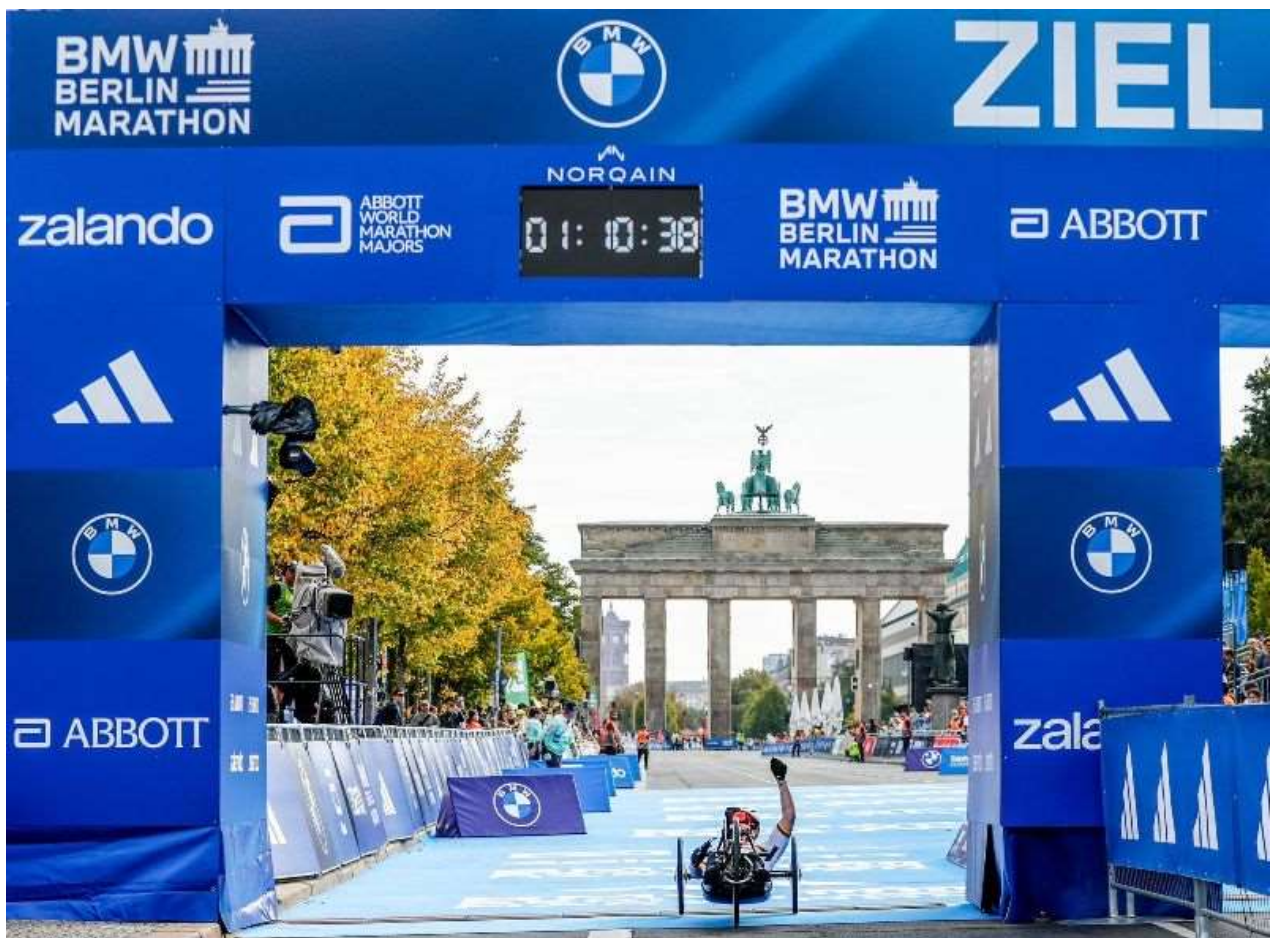
Annika beim Zieleinlauf

Fast 80.000 Teilnehmende starten am Samstag, 20.09. und Sonntag 22.09. beim Berlin-Marathon in unterschiedlichen Wettbewerben.