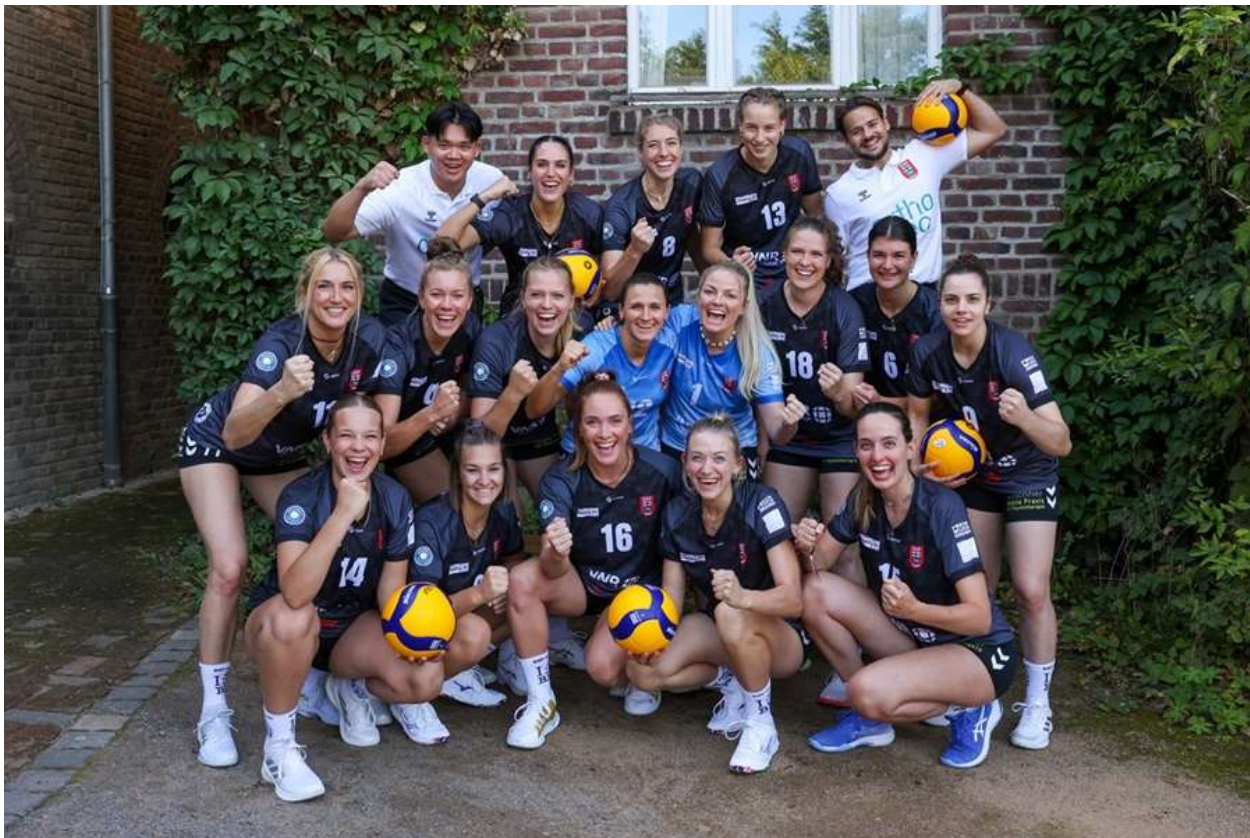
Die #bizepsvolleys freuen sich, dass es wieder los geht.