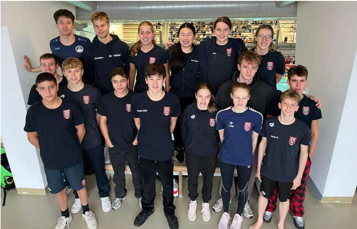
Teamfoto NRW Kurzbahn 2025

Bonn ziehen damit ein rundum positives Fazit eines sportlich erfolgreichen und organisatorisch besonderen NRW-Meisterschaftswochenendes in Wuppertal.