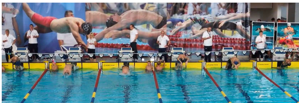
Halle NRW Kurzbahn 2025