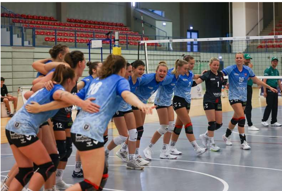
Die #bizepsvolleys wollen sich den zweiten Sieg vor heimischem Publikum sichern. ©Detlef Gottwald