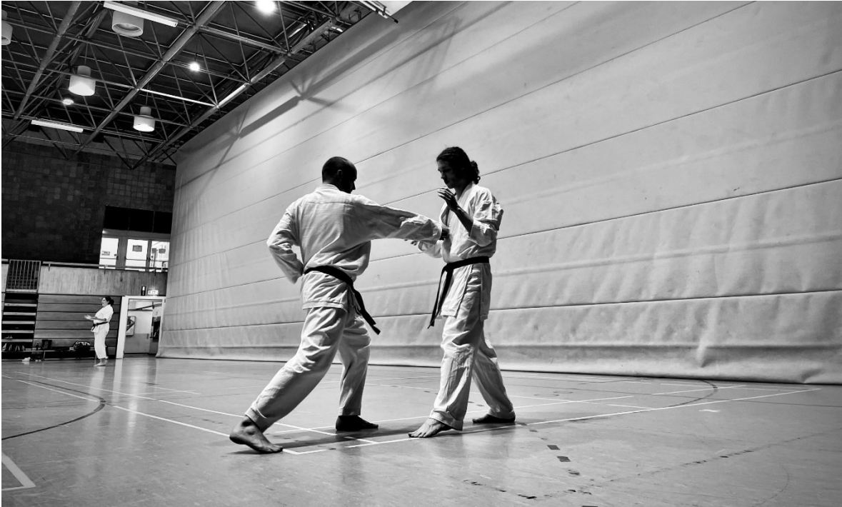
Karateka beim Zweikampf