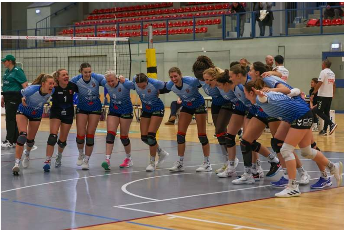
Anpfiff zum letzten Heimspiel der #bizepsvolleys am 12. April in der Hardtberghalle